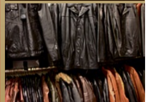
Für Lederjacken zahlen wir bis zu 3.500,- € *