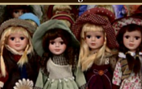
Puppen zu Höchstpreisen von 1.500,- €