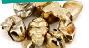
Zahngoldsammelaktion! Sie erhalten aktuell 20% mehr für Ihr Zahngold.